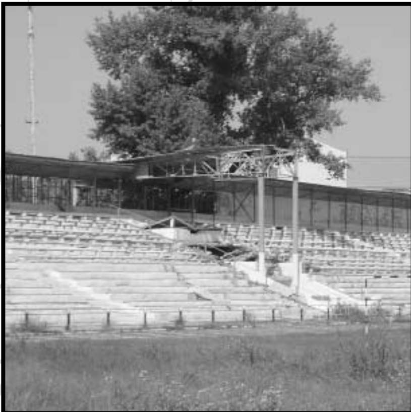
Stadion – Ort des Anschlags auf Kadyrow im Mai 2004