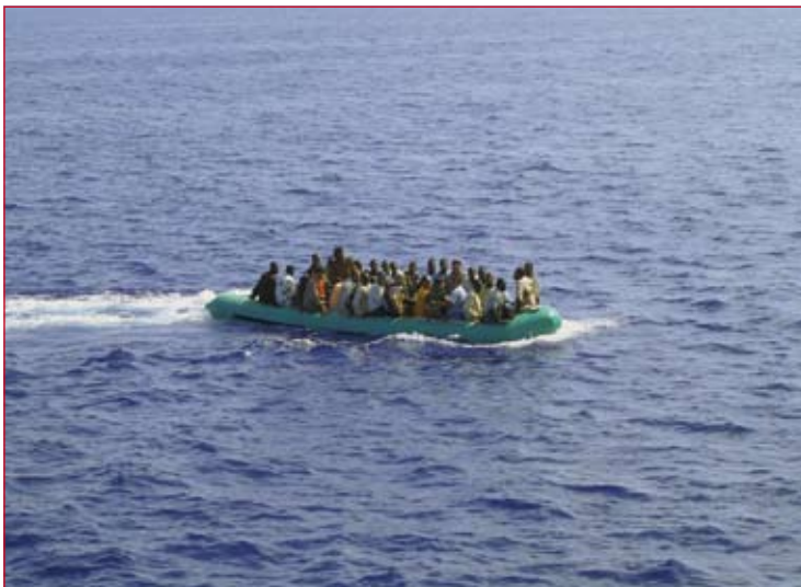
- Flüchtlingsboot vor der Küste von Lampedusa