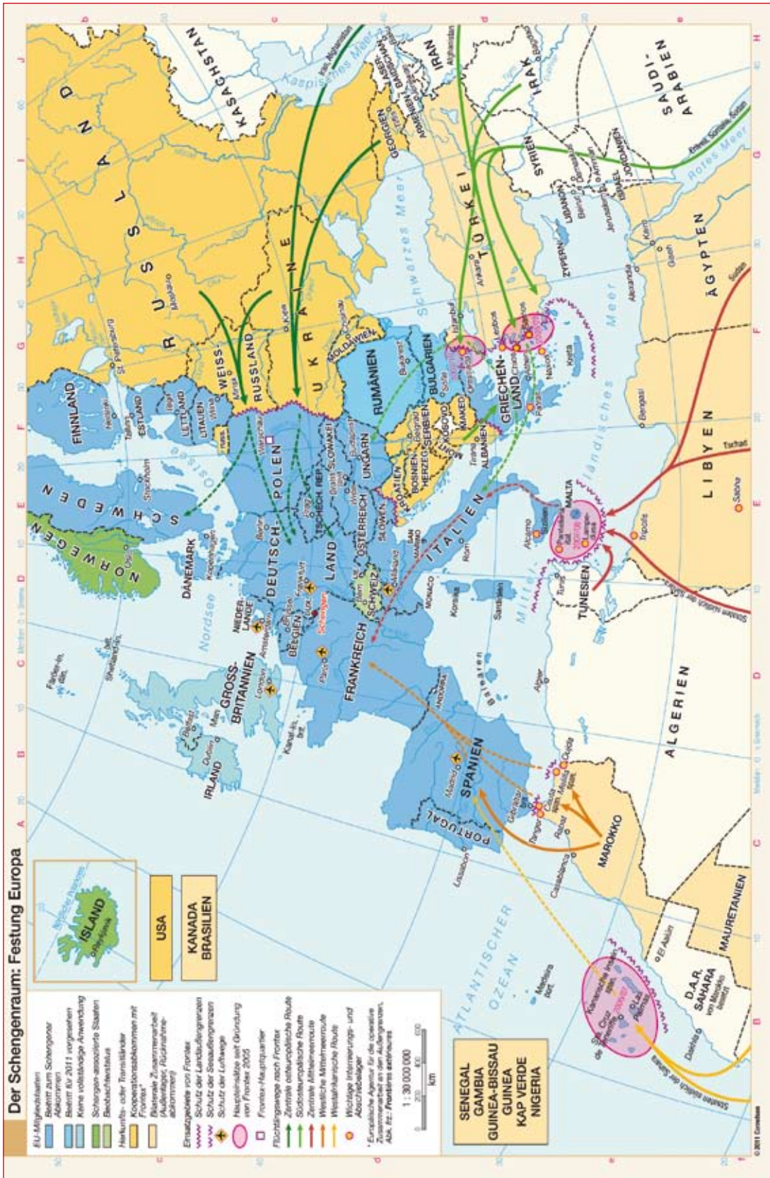
- Europakarte zu den FRONTEX-Operationen