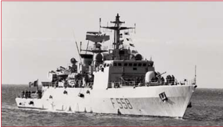
- Schiff der FRONTEX-Operation

„Der Fall der tunesischen Fischer, die am 8. August in Lampedusa verhaftet wurden, nachdem sie 44 Schiffbrüchigen das Leben gerettet hatten, ähnelt dem des deutschen humanitären Schiffes Cap Anamur, welches im Jahr 2004 37 Schiffbrüchige im Kanal von Sizilien aufnahm. Damals wurde der Verantwortliche des Komitees Cap Anamur, der Kapitän und der erste Offizier verhaftet.